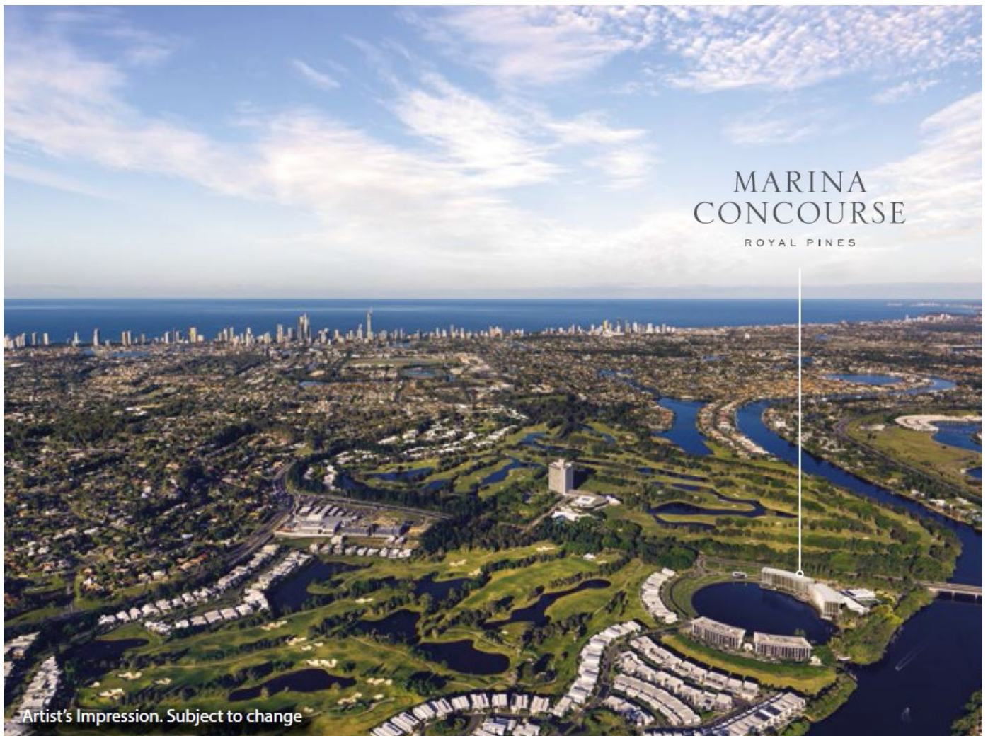
Artist's Impression. Subject to change