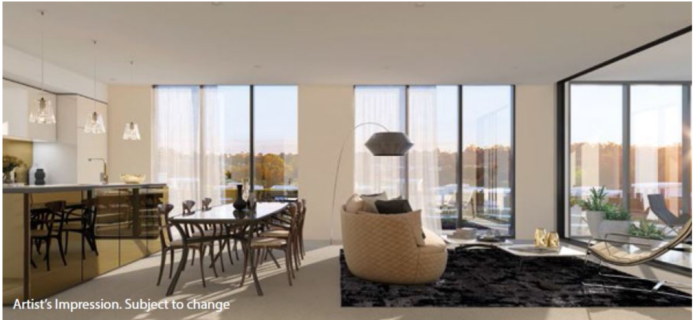
Artist's Impression. Subject to change